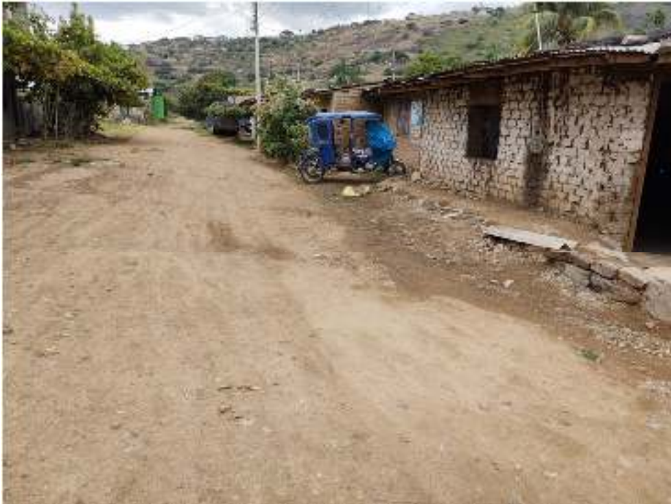
CALLE TORIBIO RODRIGUEZ DE MENDOZA DEL ASENTAMIENTO HUMANO FILA ALTA 3ERA ETAPA.