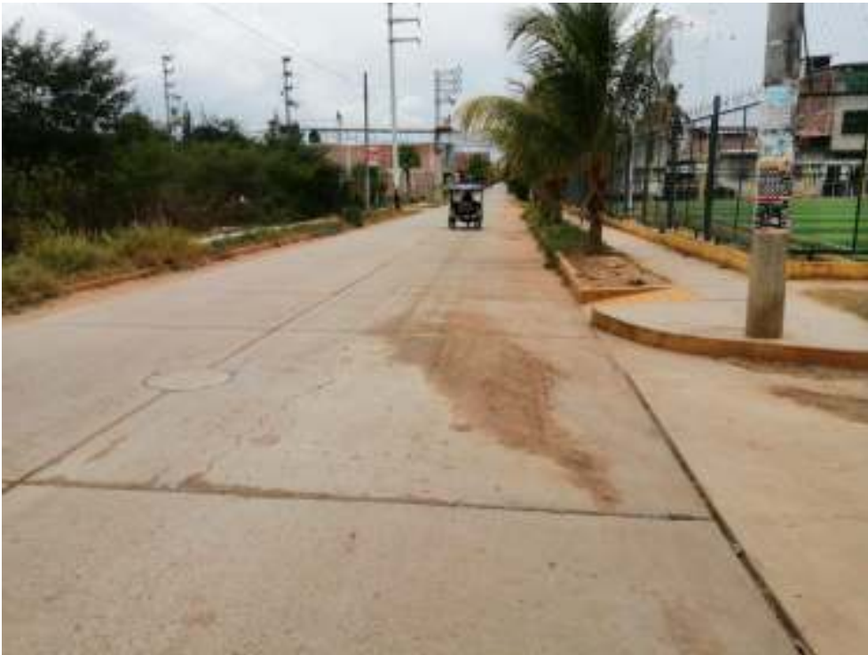
AV. VICTOR RAUL HAYA DE LA TORRE DEL ASENTAMIENTO HUMANO FILA ALTA 3ER ETAPA